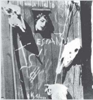
Feminismus in Spanien